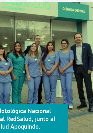
Directora Clínica Odontológica Nacional y personal RedSalud, junto al personal Apoquindo.