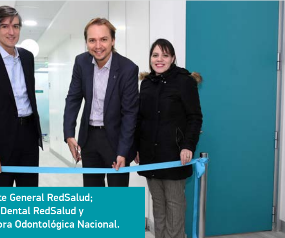
Director General RedSalud; Director Clínica Dental RedSalud y Directora Clínica Odontológica Nacional.